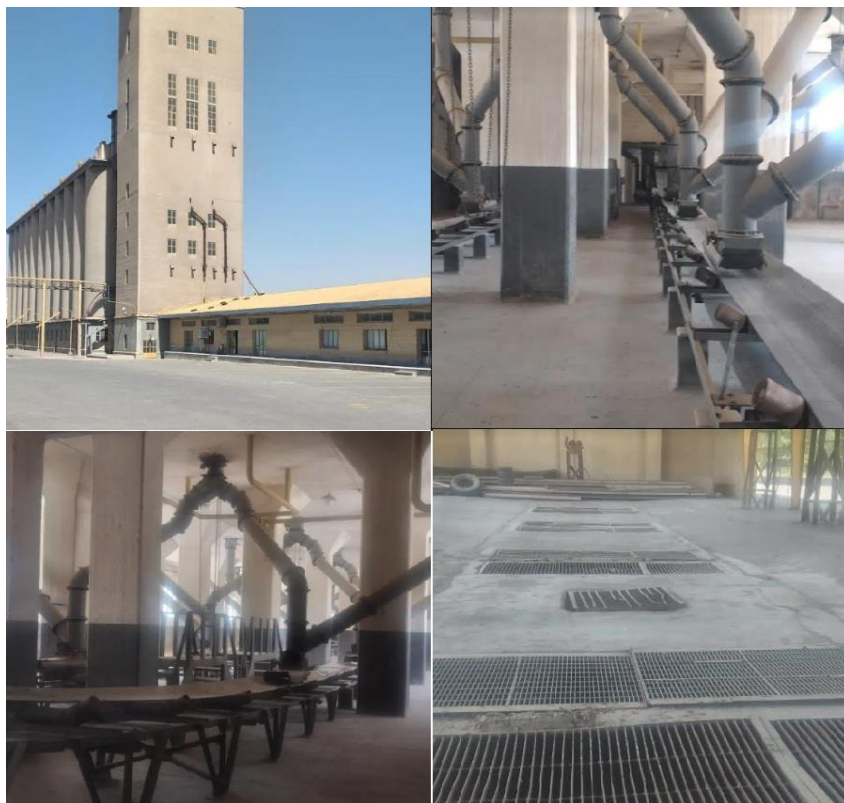
شکل ۳- سیلوی قدیم اصفهان

رنجبر (۱۳۹۷) در رابطه با سیلوی قدیم تهران بیان کرد ساختمان خاکستری رنگ سیلوی گندم با شکل و شمایل استوانه‌ای در حد فاصل بین بزرگراه بعثت و خیابان شهید رجایی واقع شده است و از این کارخانه به عنوان محل ذخیره و نگهداری گندم و جو برای تهران و دیگر شهرهای اطراف استفاده می‌شود. از زمان ساخت سیلوی گندم تهران بیش از ۷۰ سال می‌گذرد و امروزه این سیلو به عنوان بخشی از هویت تاریخی تهران شناخته می‌شود. سیلوی تهران مردادماه سال ۱۳۸۴ در فهرست آثار ملی قرار گرفت و نمونه ماشین‌های قدیمی و کل این مجموعه به عنوان آثار تاریخی تهران به ثبت رسیدند. در این پژوهش، از روش مروری روایتی