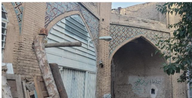
شکل ۲- قصر جمیلان محله سنبلستان، شهر اصفهان

شناسایی شده مختص شهر اصفهان هستند و قابل تعمیم‌پذیری نیست. بدیهی است موضوع کلی تحقیق و بهره‌گیری از ادبیات عامه و اساطیر و تورهای گردشگری ادبی محدود به یک جامعه خاص نیستند.