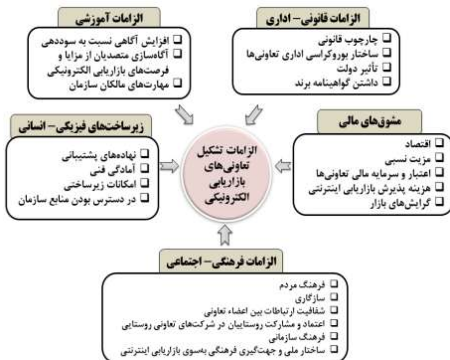
شکل ۱: چهارچوب مفهومی پژوهش

دسته‌اند. نخست، مطالعاتی که در زمینه عوامل مؤثر بر تشکیل تعاونی‌ها انجام شده است؛ دسته دوم مرور پژوهش‌هایی که به موضوع بازاریابی الکترونیکی در ایران و خارج از آن پرداخته‌اند. برخی مطالعات بر الزامات قانونی-اداری برای توسعه بازاریابی الکترونیکی تأکید دارند. در این راستا، می‌توان به کلیدواژه‌هایی چون چهارچوب قانونی، ساختار بروکراسی اداری تعاونی‌ها، تأثیر دولت و داشتن گواهینامه برند در این مطالعات اشاره کرد. در بخشی از پژوهش‌ها الزامات آموزشی شامل مواردی چون افزایش آگاهی درباره سوددهی، آگاه‌سازی متصدیان از مزایا و فرصت‌های بازاریابی الکترونیکی، مهارت‌های مالکان سازمان مورد توجه پژوهشگران قرار گرفته است. زیرساخت‌های فیزیکی-انسانی از جمله دیگر مواردی است که در مرور مطالعات قبلی در اصطلاحاتی چون نهاده‌های پشتیبانی، آمادگی فنی، امکانات زیرساختی و دردسترس بودن منابع سازمان