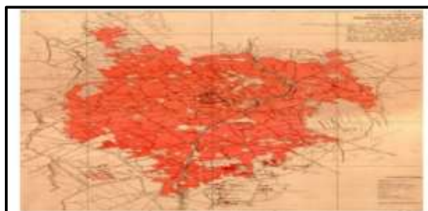
شکل ۲. نقشه بافت تاریخی همدان در سال ۱۳۳۵