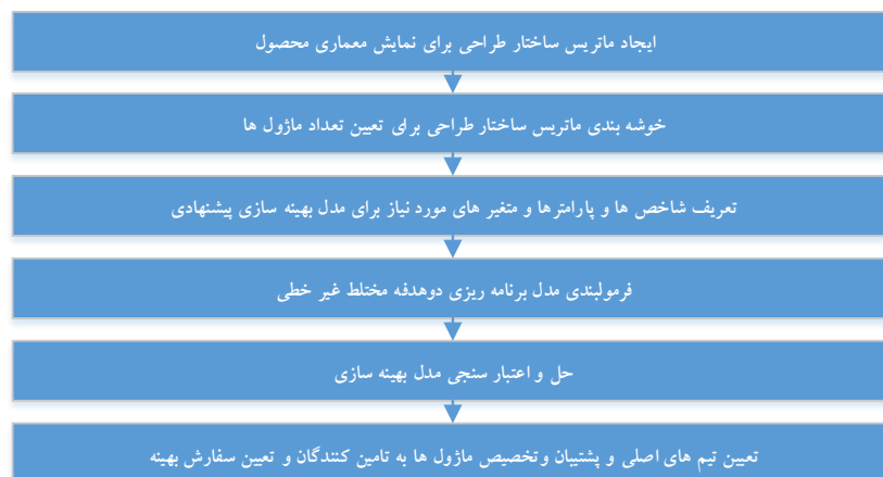
شکل ۱- مراحل پژوهش

این پژوهش از نوع کمی-کیفی است، به‌علت استفاده از نظرهای خبرگان و پژوهش‌های قبلی برای گردآوری-داده‌ها، کیفی و به‌دلیل استفاده از مدل ریاضی از نوع کمی است، روش پژوهش نیز از نوع تحلیلی است. هدف این پژوهش، ارائه مدل ریاضی برای تخصیص بهینه سفارش و انتخاب تأمین‌کنندگان به ماژول‌هاست. بنابراین پرسش اصلی پژوهش این است که چگونه با استفاده از مدل بهینه‌سازی ریاضی در ابتدای مراحل طراحی محصول ماژولار، هم‌زمان شبکه تأمین‌کنندگان مناسب را با در نظر گرفتن هزینه تعاملات داخلی و خارجی بین ماژول‌ها و شبکه و سابقه همکاری بین تأمین‌کنندگان، با در نظر گرفتن پشتیبان، مهارت و تخصیص سفارش طراحی کنیم و ماژول‌ها را به آنها تخصیص دهیم. به این منظور، ابتدا شاخص‌ها، متغیرها و پارامترهای مؤثر تعیین و اندازه‌گیری و مدل مناسب انتخاب و اجرا می‌شود. برای جمع‌آوری اطلاعات درباره مؤلفه‌ها و ابعاد مدل، مطالعات به‌صورت نظری و میدانی، انجام و اطلاعات لازم از کارشناسان، خبرگان، گزارش‌های رسمی و مستندات موجود واحد تولیدی صنعتی جمع‌آوری شده است. در پژوهش از روش مدل‌سازی دوهدفه غیرخطی مختلط عدد صحیح (MO-MINLP) استفاده شده و برای حل این روش از نرم‌افزارهای گمز و وسویور واکسل استفاده شده است. در شکل ۱، مراحل پژوهش ارائه شده است.