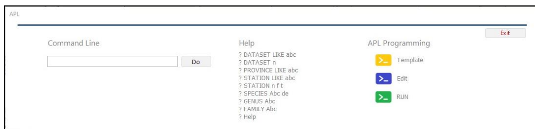
شکل ۱- رابط کاربر APL در پایگاه Alamut

در پنجره اصلی برنامه ListMaker (شکل ۲) و پنجره شکل ۳ (ویرایش) امکانات لازم برای ایجاد فهرست‌های جدید، افزودن اسامی علمی گیاهان به فهرست، دسترسی سریع‌تر به اسامی گونه‌ها در گروه‌های اصلی APG IV و ویرایش فهرست فراهم شده است. در پنجره شکل ۲ فهرست جاری با فرمان Export به شکل فایلی متنی، با فرمان Report به صورت الفبایی مرتب و با نام آتور و با فرمان Status به صورت منطبق با APG IV و با ارائه مترادف‌ها و نام‌های معتبر و مشخص کردن گونه‌های دارویی و حفاظت‌شده ارائه می‌شود.