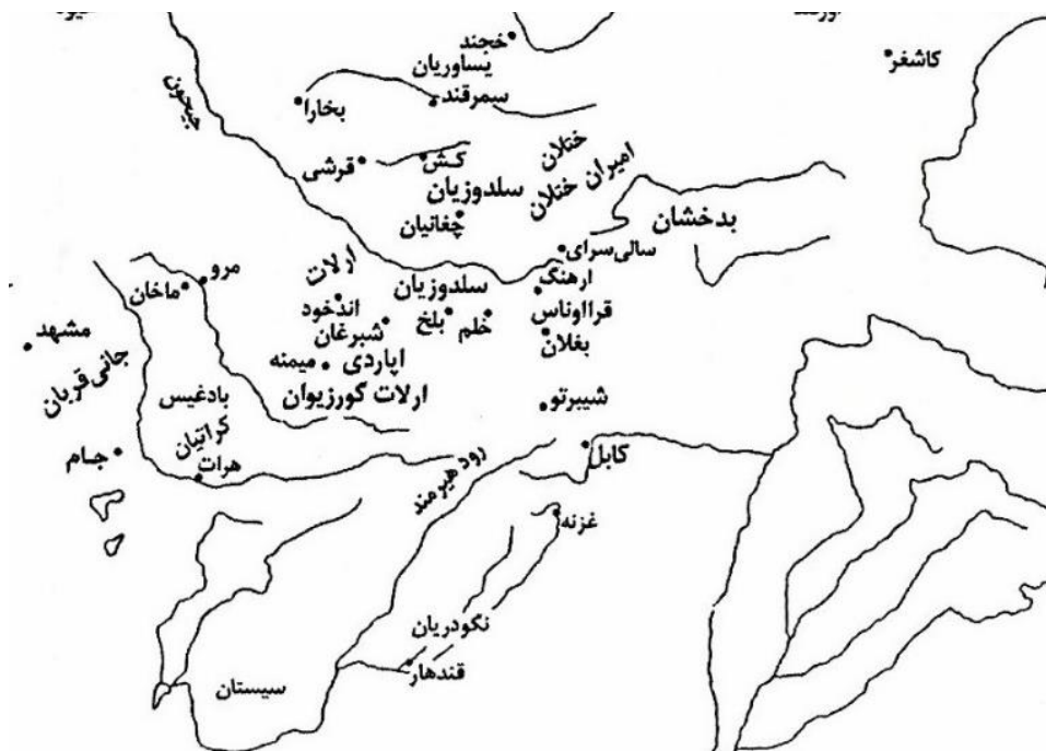
شکل ۱: نقشه جغرافیایی الوس جغتای و محل زندگی قرااوناس

وفادارترین حامیان قزغن و امیرحسین بودند (یزدی، ۱۳۸۷: ۲۵۲/۱ و ۲۶۱ و ۲۷۳ و ۳۰۸ و ۳۱۲ و ۳۱۳). بورولدای یک تومان بود که بورولدای آن را تشکیل داد. بورولدای امیر قرااوناس بود و در تابعیت ترمشیرین خان و قزغن بود (یزدی، ۱۳۸۷: ۲۵۸/۱؛ شامی، ۱۳۶۳: ۲۴).