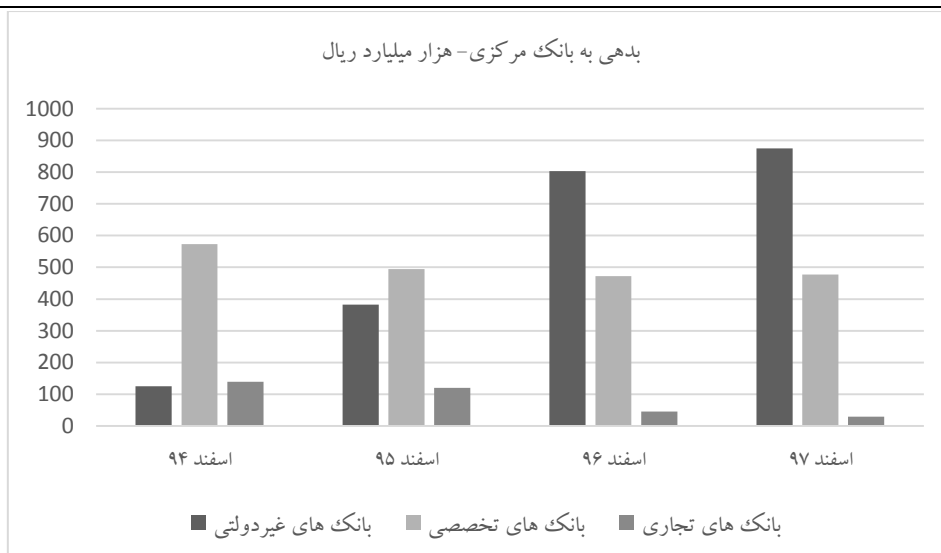
شکل (۲) بدهی بانک های تجاری، تخصصی و غیردولتی به بانک مرکزی براساس آخرین گزارش بانک مرکزی در اسفند ۱۳۹۷