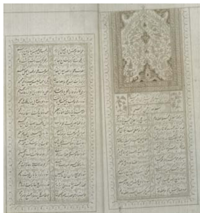
صفحه نخست از نسخه ۱۰۶۳ کتابخانه مجلس