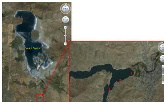
شکل ۱- عکس هوایی و سایت‌های نمونه‌برداری دریاچه سد مهاباد

ابتدا خانواده Scenedesmaceae در نمونه‌های آبی کشت داده شده شناسایی و با استفاده از روش‌های جداسازی در چندین نمونه تهیه، خالص‌سازی شد. تفاوت‌های نخستین مشاهده شده میان جمعیت‌های جدا شده در برخی عوامل مورفولوژیک و فیزیولوژیک، احتمال وجود دو جنس مختلف از این خانواده را مطرح نمود. جداسازی نخستین جنس‌های احتمالی این خانواده به روش مستقیم زیر میکروسکوپ نوری و همچنین، با کشت سریالی بر محیط کشت جامد و مایع انجام گرفت. به علت شباهت‌های مورفولوژیک و فیزیولوژیک بسیار زیاد جنس‌های خانواده Scenedesmaceae ، شناسایی دقیق جنس و گونه به روش مولکولی مقدور شد.