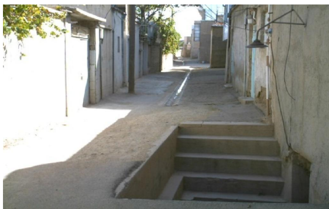
شکل ۲) تصویر پیش‌آمدگی ورودی منازل در معبر