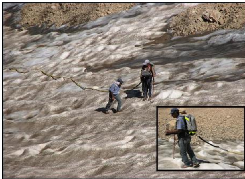
شکل ۲) عملیات عمق سنجی مؤسسه تحقیقات آب در بخشی از یخچال های زردکوه در شهریور ۱۳۸۹

حجم این یخچال ها با استفاده از اطلاعات جمع آوری شده از سطح آنها و بر اساس روابط تجربی ذکر شده در بخش ۲-۳ برآورد شد، که نتایج در شکل (۳) قابل مشاهده هستند. ملاحظه می گردد که نتایج حاصل از روش Bahr و همکاران (۱۹۹۶، ۲۰۳۵۵)، بیشترین شباهت را با اندازه گیری های انجام شده دارد، ضمن اینکه بیشترین مقدار را هم برآورد می کند. برتری این روش در تحقیقات مشابه برای یخچال های آلپاینی و نیمه آلپاینی نیز تأیید شده است (Farinotti et al., ۲۰۰۹, ۲۲۵).