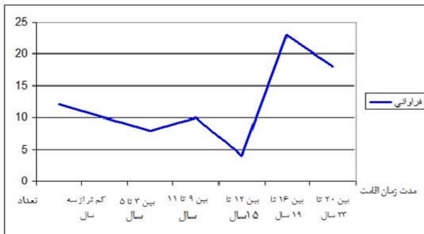
نمودار شماره ۱: مدت زمان اقامت خانوارها در محله باباجعفری در جامعه نمونه آماری