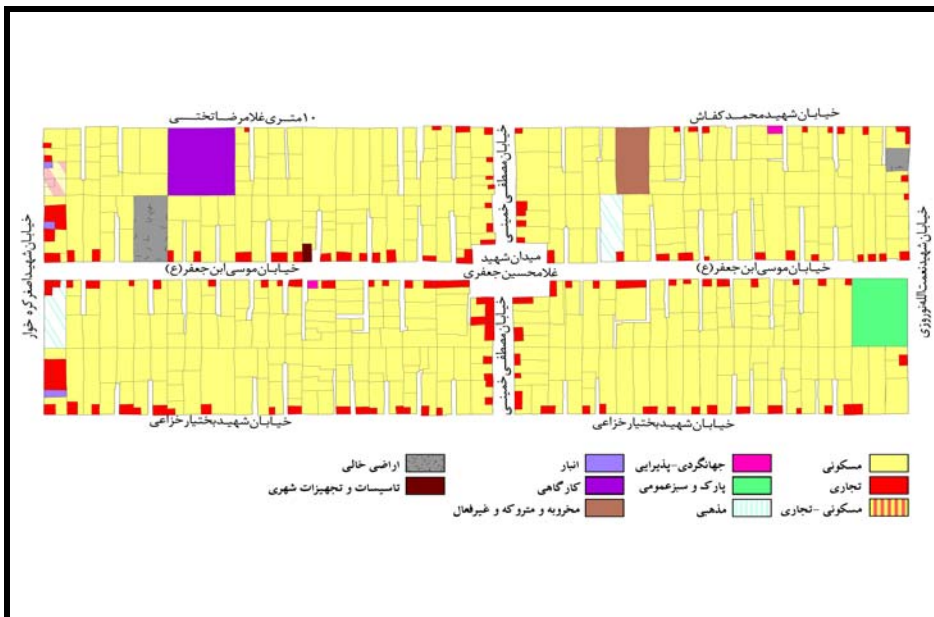
نقشه شماره ۳: کاربری اراضی وضع موجود محله بابا جعفری