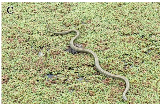
شکل ۴- (A) آب بند سید محله در ساری، (B) آب بند زاغمرز در بهشهر، (C) آب بند نیروگاه برق، حرکت مار بر روی لایه های متراکم Azolla در سطح آب