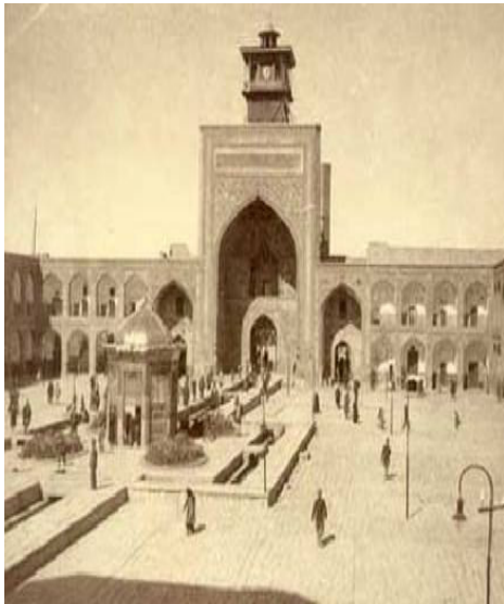
تصویر ۱: عبور نهر آب از حرم مطهر - تصاویر تاریخی شهر مشهد.

و یکی در بالا... آنکه در بالا بود... در میان هشت بهشت از حوضهایی که در میان آن عمارات عالیه ساخته بودند، فواره می‌جست. و فاضل آبی که در آنجا جمع می‌گردید، در زیر زمین شترگلو و نوجه‌ها از سنگ تعبیه نموده، آب را در همه جا از زیر خیابان آورده، و در میان صحن مقدس از زیر حوض چون فواره بیرون آمده، و حوض مملو از آب شده، و از دور حوض که آب جاری می‌گردید، به همان نهر مذکور به سمت محلات خیابان می‌رفت» (مروی، ۱۳۷۴: ۲۰۳)