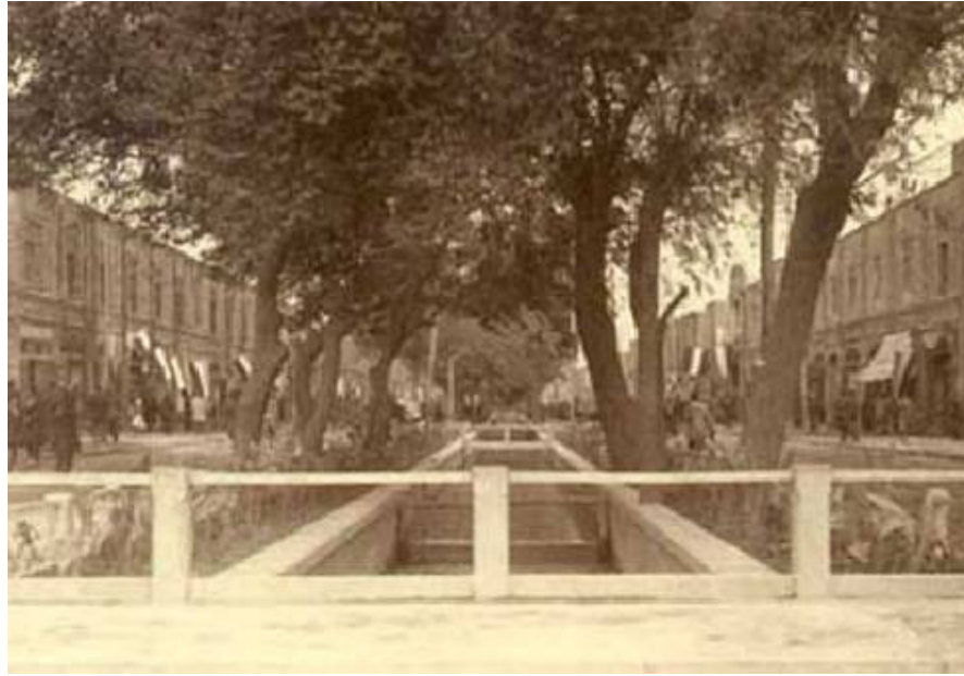
تصویر ۳: خیابان (چهارباغ) شهر مشهد- تصاویر تاریخی شهر مشهد

۵-۶- استفاده از عناصر تقویت کننده سیمای (ویژگیهای ذهنی) راه.