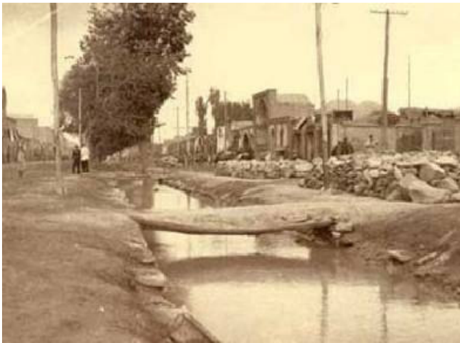
تصویر ۲: خیابان (چهارباغ) شهر مشهد- تصاویر تاریخی شهر مشهد ( http://www.panoramio.com/photo/5443421 )

عریضی که در وسط خیابان قرار دارد (تصویر ۲) و ماریچ گونه ۲ از میان شهر می‌گذرد، منظره‌ای به غایت دلپذیر به شهر بخشیده است. در دو سوی این نهر، به فاصله‌های معین درختانی کاشته‌اند که مردم در زیر سایه آنها می‌آرمند؛ و در واقع، این ممیزه است که مشهد را یکی از دلرباترین شهرهای ایران می‌کند» (Vambery, 1973: 284-285)